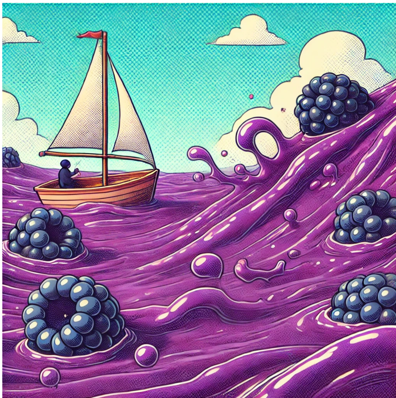
Image : Imaginez-vous naviguer sur une MeR remplie de confiture de MûRes.